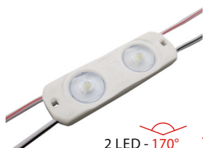
2 LED - 170°