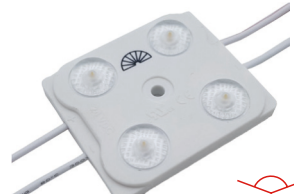
4 LED - 175°