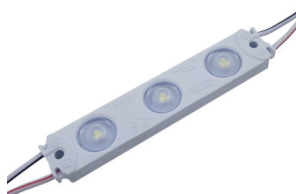
3 LED Economic